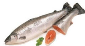
노르웨이 연어 한국 수출액과 수출량